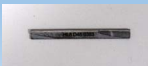
Figura 4: Pietra per Levigatura