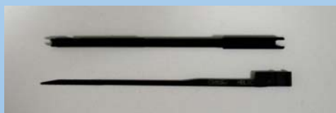
Figura 3: Mandrino con cuneo di espansione